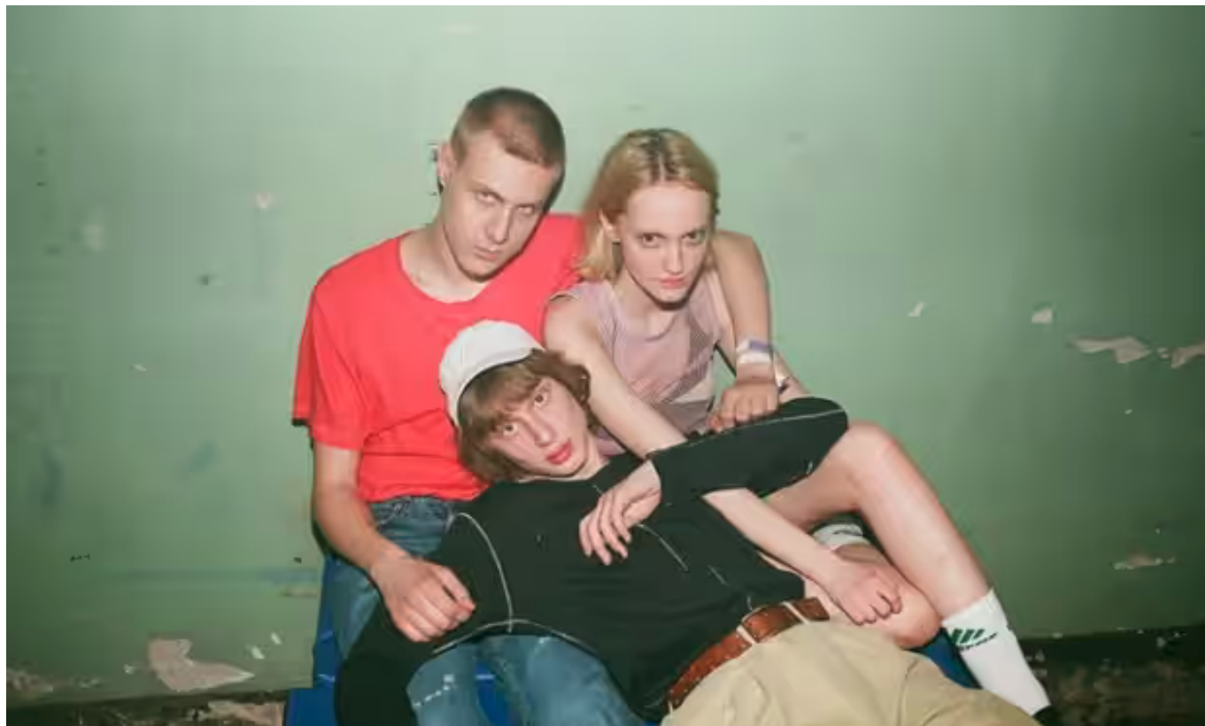
“Обыкновенные” модели Lumpen - агентства, пытающегося разрушить стереотипы о красоте.

У моделей Lumpen взъерошенные волосы, мешки под глазами, а на лицах царапины. Не потому что их специально передевали и гримировали, чтобы придать им “нормальный вид”, а просто они так и выглядят в жизни.