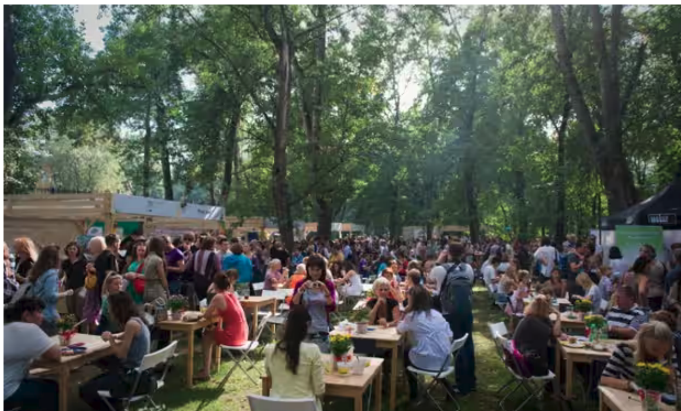
За трансформацией Парка Горького последовали и другие городские преобразования.