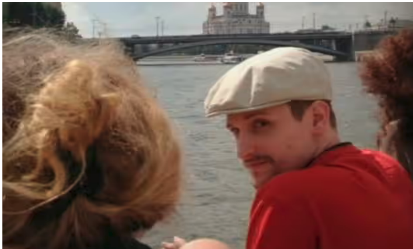
Эдвард Сноуден на Москве-реке в октябре 2013 года.

Эдвард Сноуден, сотрудник Агентства национальной безопасности США, прославился тем, что предал огласке массовую слежку, которой занимались его работодатели. Ему тогда было 29 лет. Прошло два года, и сенат Соединенных Штатов на днях принял закон, запрещающий массовый сбор данных о телефонных звонках. Однако Сноуден говорит, что работы у него как никогда много.